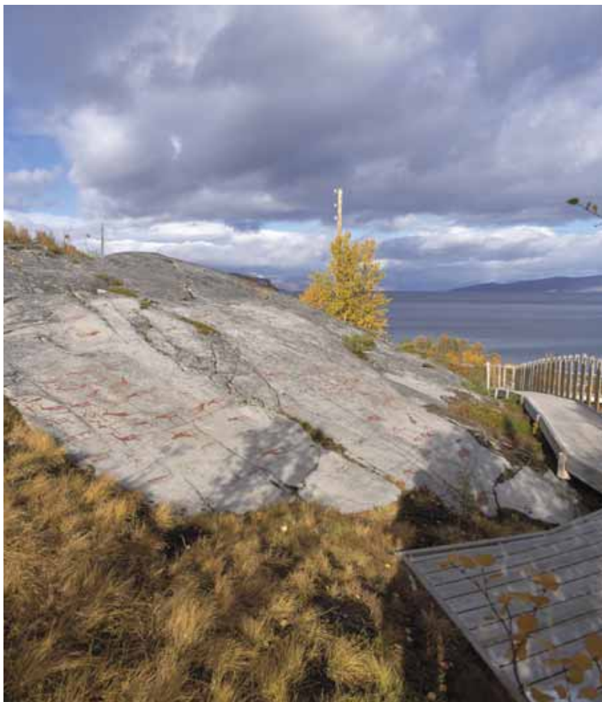
Helleristninger i Alta.

De nordiske landene er representert i Verdensarvkomiteen, og har en felles agenda når det gjelder verdensarv: